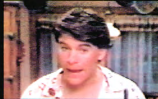
ジェフ (声 真殿光昭)

サラの兄。両親が出かけ、家の留守を守ることになるが、何か隠し事をしているらしい…。